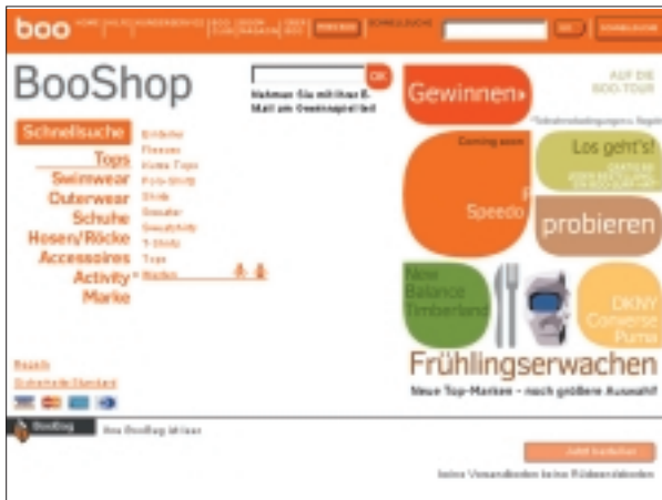
Vorbildliche Navigation links, Benutzerverwirrung rechts

des Portals ausgeblendet. Es wird weitestgehend auf Grafiken verzichtet. Auf der Eingangsseite finden sich neben dem Unternehmenslogo nur vier Navigations-Buttons. Trotz der Erweiterungen des Dienstes haben sich Layout und Navigation im Lauf der Jahre nicht verändert.